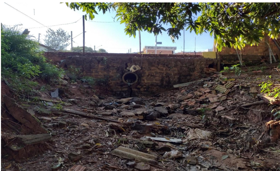
Foto1- Rua Antonio Zeferino, local onde será demolido e reconstruído o muro de arrimo