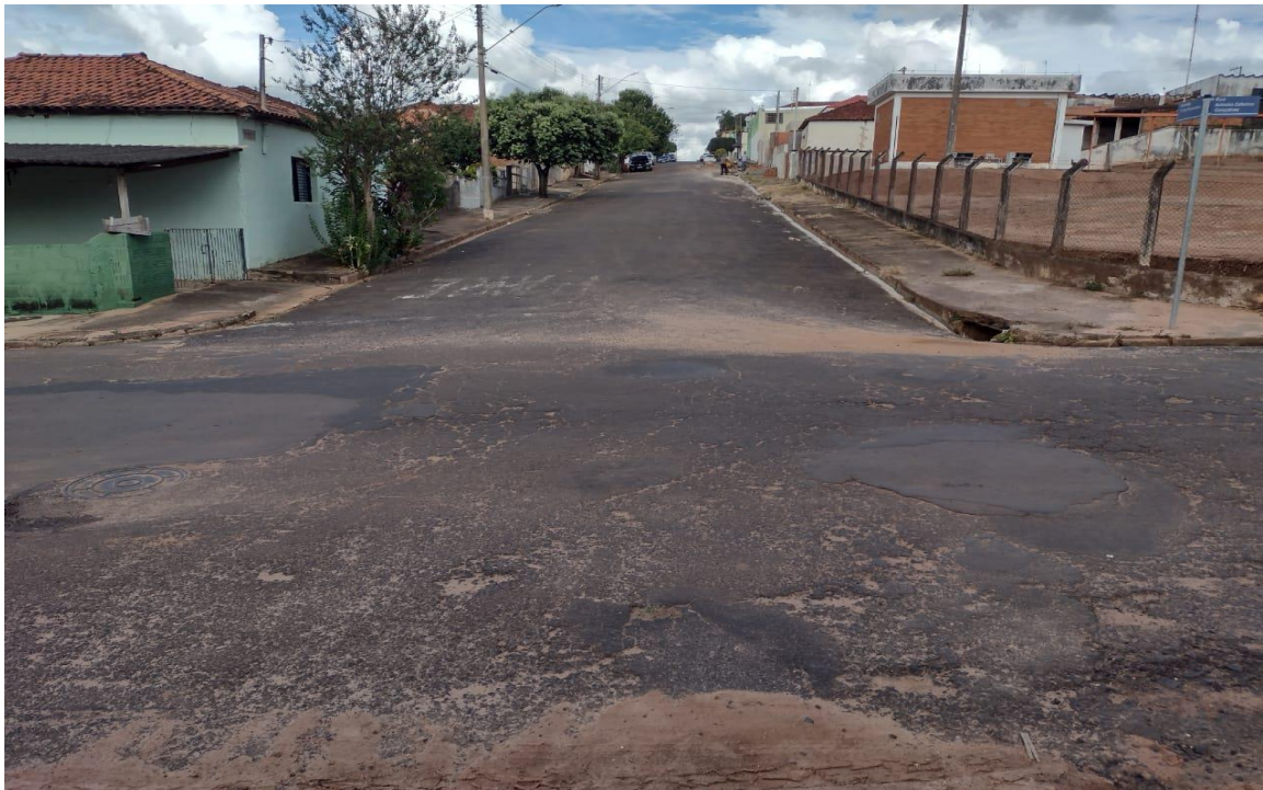
Foto 3- Continuada da rua XV de novembro abaixo do muro de arrimo Trecho (53 e 53 A)